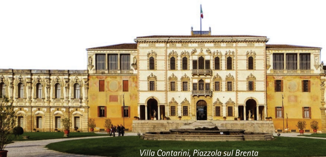
Villa Contarini, Piazzola sul Brenta