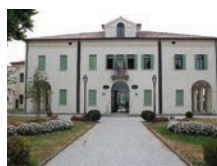
VILLA OBIZZI Albignasego via Roma 163

Paesaggi sonori In viaggio oltre J.S.BACH