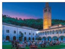
CHIOSTRO SALESIANI DI MONTEORTONE Abano Terme via S. Marco 130

Risalente al XVII secolo, ha un impianto rinascimentale, ma alterato da pesanti interventi architettonici e stilistici avvenuti nell'Ottocento. La villa, circondata da un bellissimo giardino ora diventato il "Parco della Rimembranza", è passata di mano dagli Obizzi, nobile famiglia di Lucca a Padova dal 1285 (accostata alla figura di Pio Enea II Obizzi), ai Da Porcia e ai Salom, per finire di proprietà dell'Amministrazione Comunale dal 1903. Oggi è sede del Comune e della biblioteca.