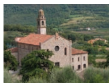
CHIESA DI SANTA MARIA ASSUNTA Arquà Petrarca Piazza Petrarca 5

Il chiostro originariamente faceva parte del cinquecentesco convento degli Eremitani di S. Agostino della B. V. Maria di Monteortone. A metà del XIX secolo il monastero, ormai in abbandono ma ricco di una generosa sorgente termale denominata "Della Vergine di Monteortone", fu trasformato nel prestigioso "Grande Stabilimento Termale di Monteortone". Nel 1937 fu acquisito dai Salesiani di Don Bosco che adattarono il monastero a seminario teologico e nel 1970, lo sistemarono come "Casa di ospitalità San Marco".